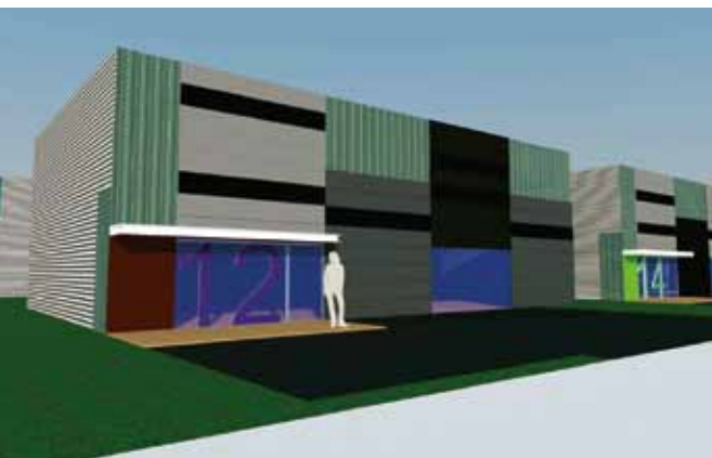
Le programme comprend sept bâtiments individuels de 182 à 352 m 2 .

La SHEMA lance la commercialisation d'un programme de sept ateliers non mitoyens sur le Parc d'activités de Cardonville à Bretteville-l'Orgueilleuse.