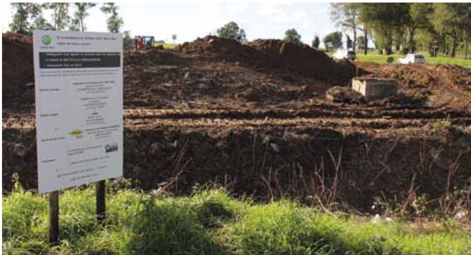
L'ouvrage pourra retenir 17 000 m 3 d'eau.

et Mue, en charge de l'Espace et de l'aménagement du territoire. Dans les mois à venir, des réunions de concertation seront organisées dans cette perspective avec les propriétaires et exploitants des terrains concernés ».