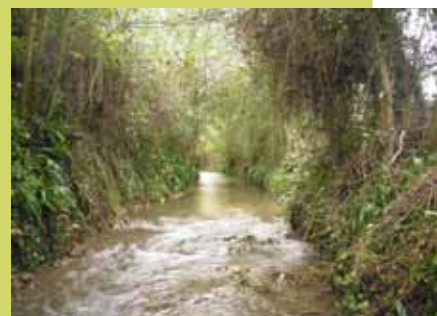
La Mue avant et après l'entretien effectué par le Syndicat.