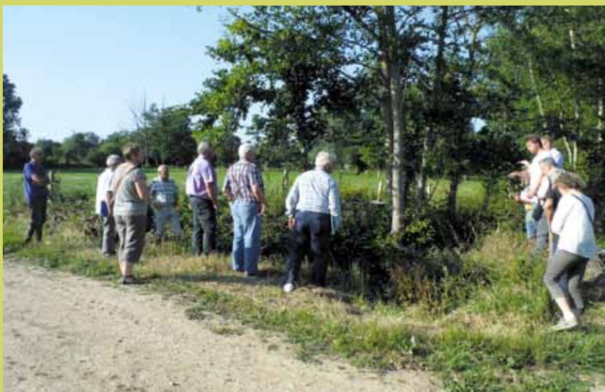
Les techniciens du Syndicat Mixte de la Seulles et de ses Affluents sont à disposition des riverains pour les conseiller.