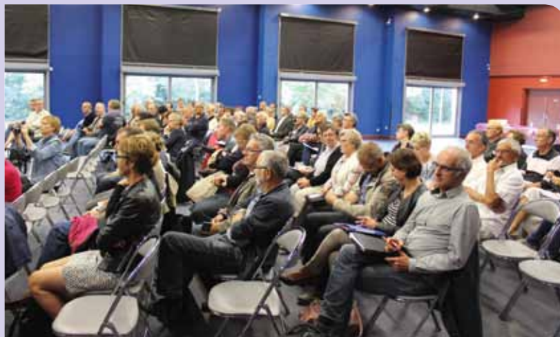
Les 187 élus du territoire de la CdC ont été conviés à une présentation des deux scénarios le 17 septembre à Rots.

Vous pouvez réagir dans la rubrique contact du site internet entrethueetmue.com